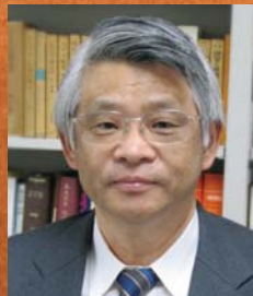
高坂 史朗 教授