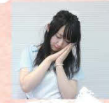
おやすみなさーい……